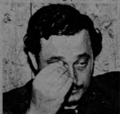
La cosa no la veo tan fea. Estoy seguro de que lograré mi libertad por métodos pacíficos, afirma el comandante Plutarco Hernández, con un muy significativo gesto

Procesal Penal, el Tribunal puede suspender la ejecución de la sentencia y ponerlo en libertad, con caución o sin ella.