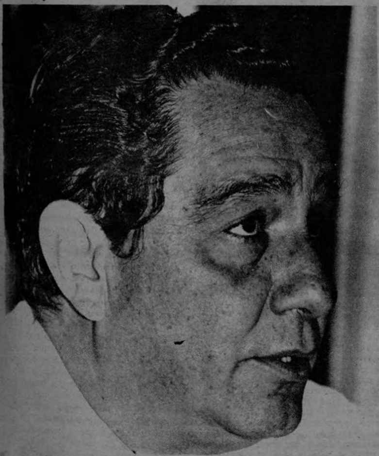
Rodolfo Quirós González, Ministro de Industrias, confirmó a Pueblo el alza de precio de los artículos básicos de consumo popular.