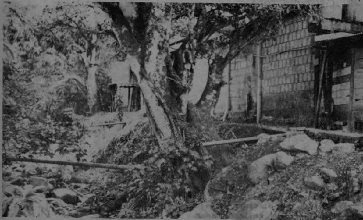
Aparte de que la disposición de agua en el Valle Central amenaza tornarse aun más crítica, la contaminación por desechos industriales irá dificultando en extremo su uso. Industrias como ésta deben responder cuanto antes al llamado de alerta hecho por los técnicos.

En la actividad participarán varias instituciones del Estado y también una serie de entes privados.