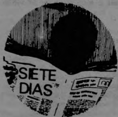
DOMINGO: Café, cemento y Aldo Moro.

En la reunión del domingo en el Gimnasio Nacional, intervinieron el grupo "Uxmal", con música folclórica latinoamericana, el Conjunto Folclórico Nacional; el conjunto "Emergencia Nacional", con música protesta y folclórica, el Grupo de Patinaje Artístico; la Banda del Instituto de Alajuela y el cantante Luis Enrique Mejía.