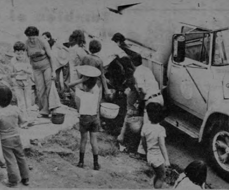
Muchos trastornos ha ocasionado la falta de agua en el distrito de San Josecito de Alajuelita. De vez en cuando aparece un camión del I.C.A.A. para dejar un poco de agua a los vecinos del lugar. La paciencia de la gente ya se está agotando.

Al parecer en los últimos días los guardias rurales de Pérez Zeledón agredieron salvajemente a unos jóvenes sin que existieran causas que puedan justificar esta acción ilegal. Uno de los muchachos fue baleado y hubo necesidad de hospitalizarlo.